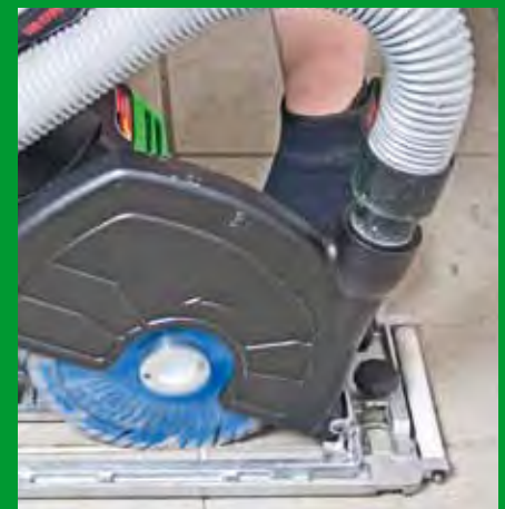
Fugensanierung hier: Trockenschnitt mit Eintauchtiefenbegrenzung