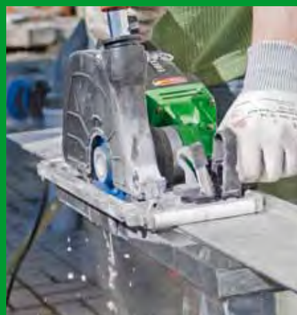
Naturstein-Küchenarbeitsplatte ablängen hier: Nassschnitt mit Führungsschiene