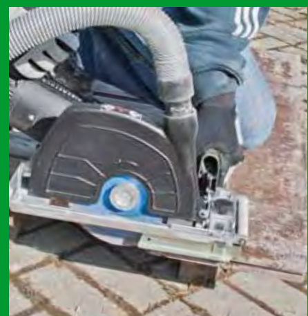
Betonborde im Galabau hier: Trockenschnitt