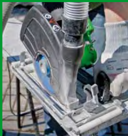
Natursteinfensterbank – Tropffuge hier: Trockenschnitt mit Eintauchtiefenbegrenzung