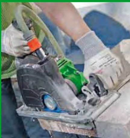
Naturstein-Setzstufe kürzen hier: Nassschnitt mit Winkelanschlag

Winkelanschlag – einfaches Ablängen unabhängig der Werkstückgröße