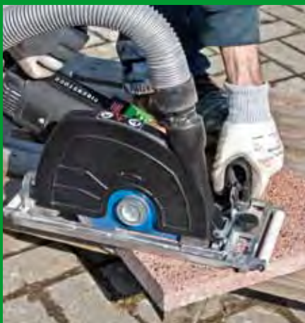
Betonwerkstein – Terrassenplatten hier: Trockenschnitt