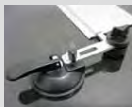
Vakuumbefestigung der Führungsschiene mittels Saughalter, optimal auf Fußböden und beispielsweise für Ausschnitte in große Platten