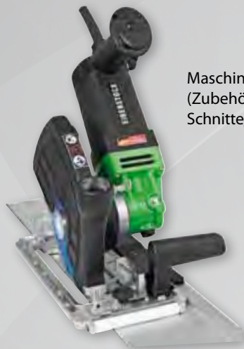
Maschine auf Führungsschiene (Zubehör) – als Anschlag für präzise Schnitte, unbegrenzt verlängerbar

* mit Diamanttrennscheibe Ø 200 mm (Zubehör)