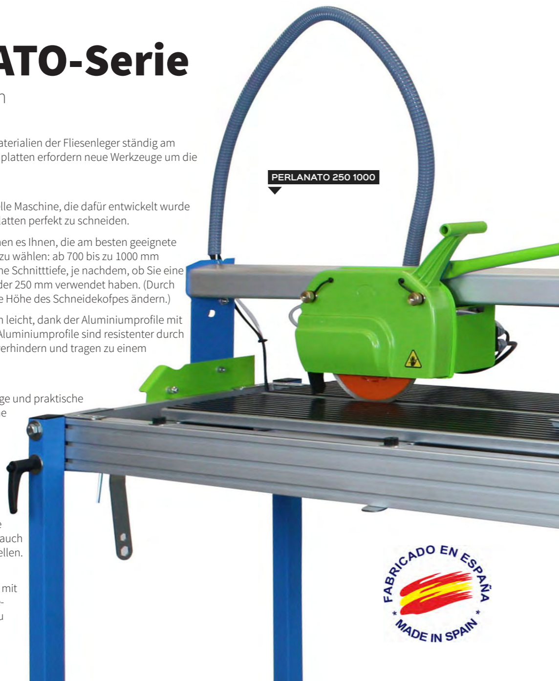
PERLANATO 250 1000

Als weiteres Zubehör (auch optional) besitzt die Perlanato, Tischverlängerung mit Klemmgriffen, um die grosse Schneidstücke sicher und präzise schneiden zu können.