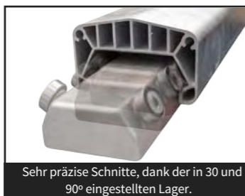
Sehr präzise Schnitte, dank der in 30 und 90° eingestellten Lager.