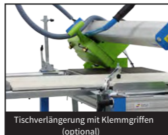
Tischverlängerung mit Klemmgriffen (optional)