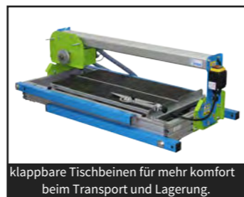
klappbare Tischbeinen für mehr Komfort beim Transport und Lagerung.