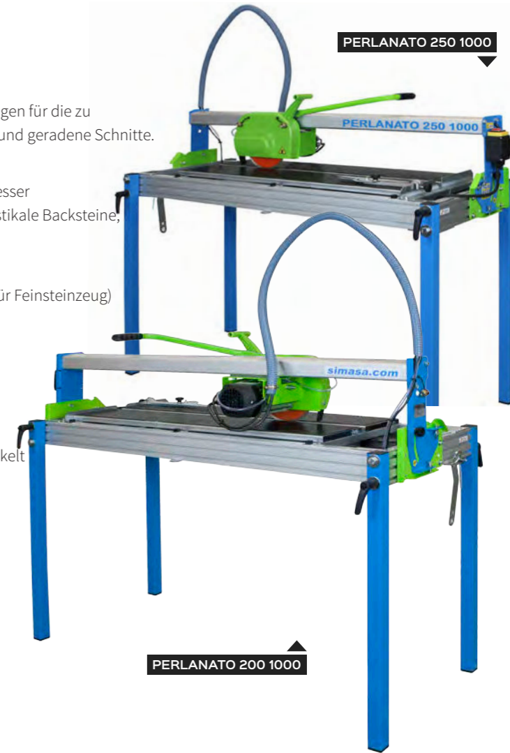
PERLANATO 250 1000