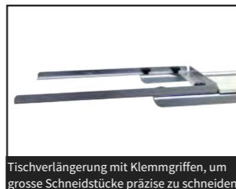
Tischverlängerung mit Klemmgriffen, um grosse Schneidstücke präzise zu schneiden.