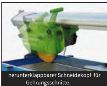
herunterklappbarer Schneidekopf für Gehrungsschnitte.